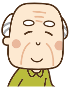
表1の人称代名詞を、色々な文章の中で使ってみましょう。